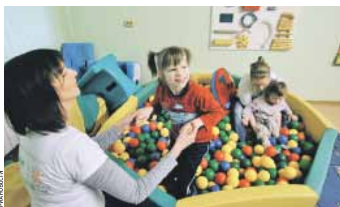
В этом году московские дети с особенностями в развитии будут проходить санаторно-курортное лечение в основном летом

ции детей-инвалидов. Кроме того, заключены контракты с негосударственными организациями, такими как Реабилитационный центр «Преодоление», Научно-производственный центр «Огонек», Центр лечебной педагогики, Марфо-Мариинский медицинский центр «Милосердие» и другие. Также на базе санаторных лесных школ № 4 и 7, находящихся в ведении Департамента соцзащиты, для детей с ограничениями по здоровью в июне организованы оздоровительные смены. Второй вид услуг — это санаторно-курортное лечение. На учете в органах социальной защиты населения Москвы на получение путевок состоит 12,3 тысячи детей-инвалидов. В этом году для этой категории детей закуплено около 16 тысяч путевок для обеспечения 7700 детей-