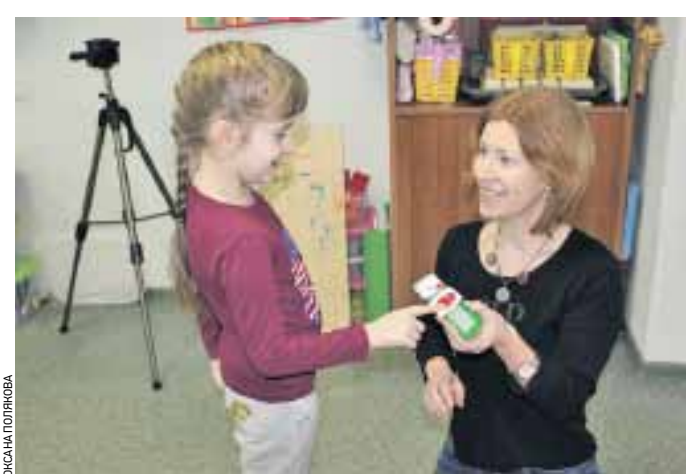
Чтобы научить ребенка сотрудничать, необходимо найти к нему подход. А похвала поможет закрепить полученные навыки