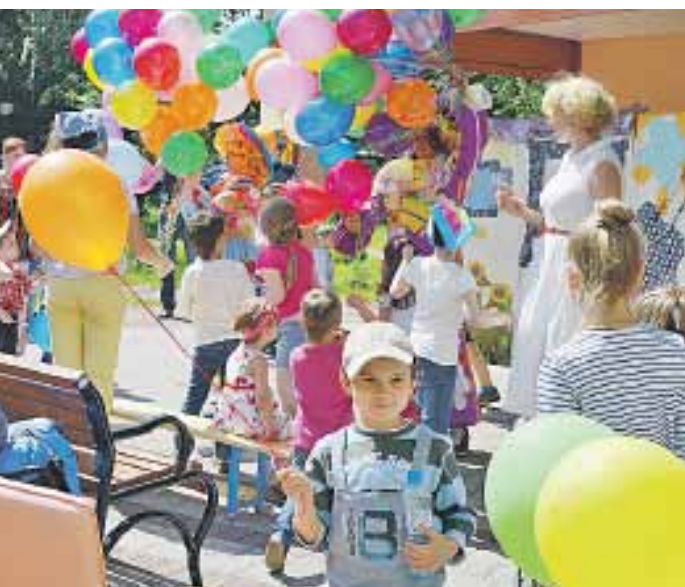
Юные подопечные Московского научно-практического центра реабилитации инвалидов вследствие ДЦП в восторге от праздника, устроенного специально для них