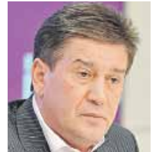
Инвалиды-колясочники, и в первую очередь дети, должны иметь преимущества при обслуживании социальным такси

Много. В Москве сегодня насчитывается 1,2 миллиона инвалидов, 2,8 миллиона пенсионеров, около 300 тысяч детей из малообеспеченных семей, 92 тысячи многодетных семей. И плюс 147 тысяч ветеранов войны — они у нас вообще вне очереди и вне категорий...