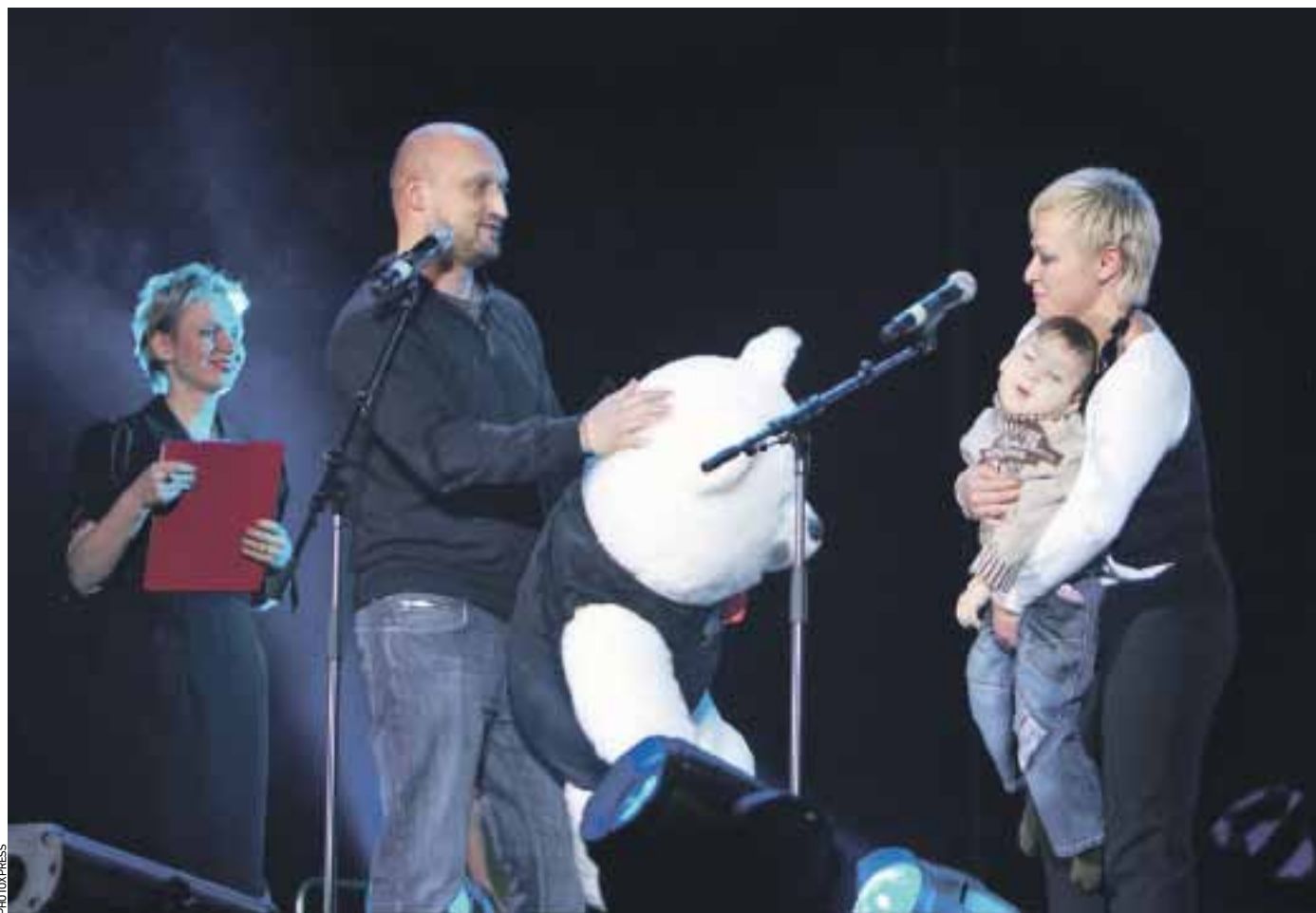
«Когда я увидел глаза этих детей, меня поразило их беззащитное обаяние, — говорит Куценко. — Я понял, что должен помогать им»