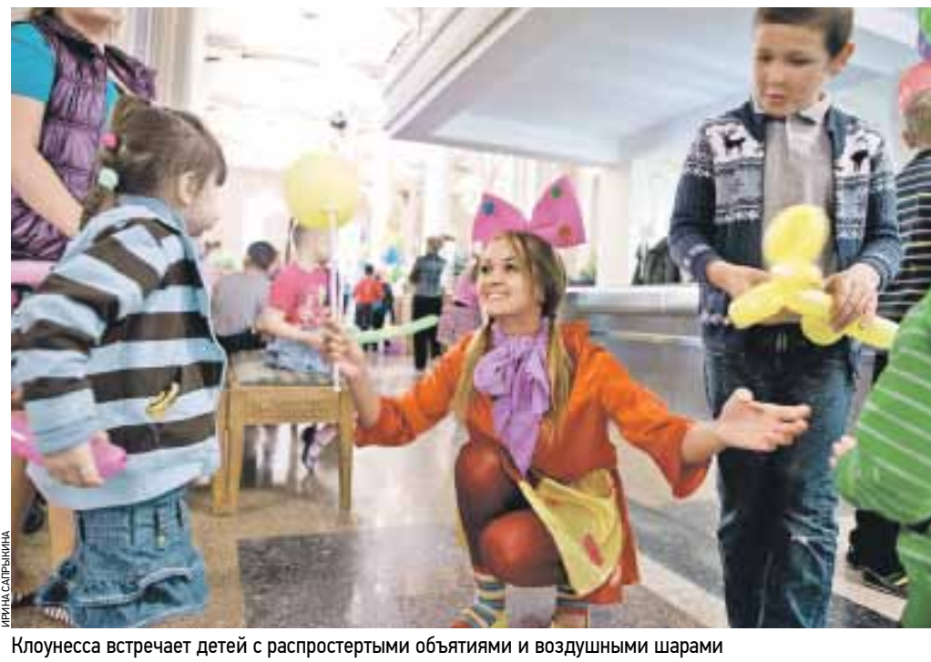
Клоунасса встречает детей с распростертыми объятиями и воздушными шарами

А перед началом мероприятия гостей развлекали веселые клоуны. Девчонки и мальчишки с удовольствием участвовали в занимательных играх и познавательных конкурсах. А юные принцессы, между прочим, заглядывали в салон красоты, где маленьким модницам заплетали необычные косы. Кроме того, для всех желающих в коридорах зала появились волшебные феи, воздушные бабочки, благодарные рыцари, отважные супергерои и другие сказочные персонажи. Вот в таком ярком виде ребята и отправились на концерт, на котором песни, танцы и слова-подарения были посвящены им и только им.