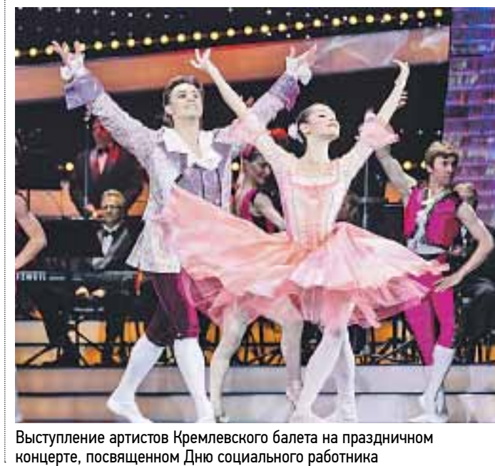
Выступление артистов Кремлевского балета на праздничном концерте, посвященном Дню социального работника